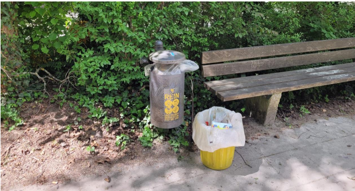
Abbildung 3-5: Übervolle Mülleimer, teilweise mit zusätzlichen Behältern von Anwohner*innen

FRAKTION BÜNDNIS 90/DIE GRÜNEN München, 20.05.2024