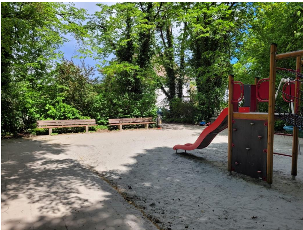
Abbildung 2: Spielplatz, Blick Richtung Norden, Bild: privat