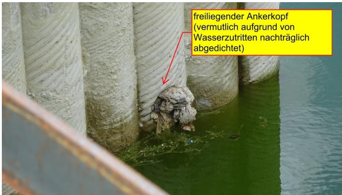
Abbildung 3: freiliegender Ankerkopf