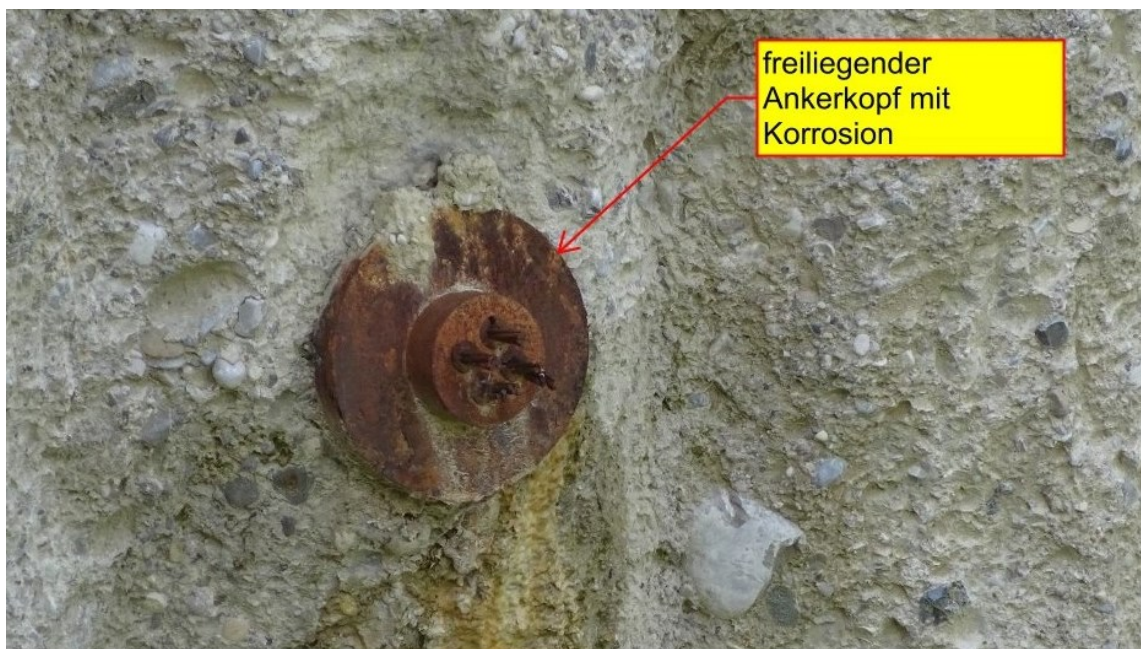
Abbildung 4: freiliegender Ankerkopf – Verpressanker mit 4 Litzen