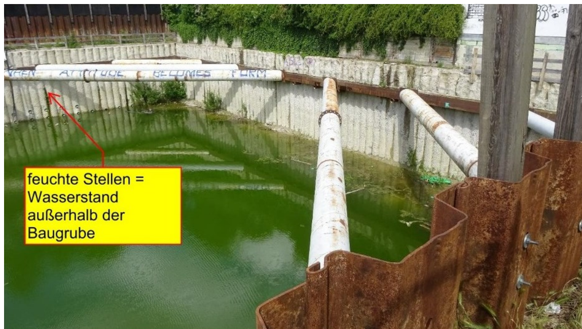
Abbildung 2: Baugrubenaussteifung im Bereich der östlichen Baugrube