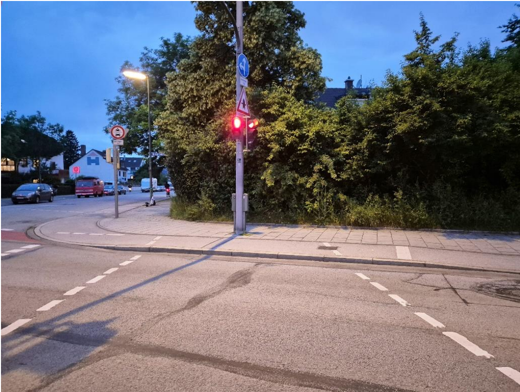
Schatzbogen nordwestlich I: Keine Bordsteinabsenkung an der Ampel.