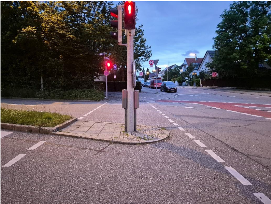
Schatzbogen südlich: Ampel steht mitten auf dem markierten Überweg.