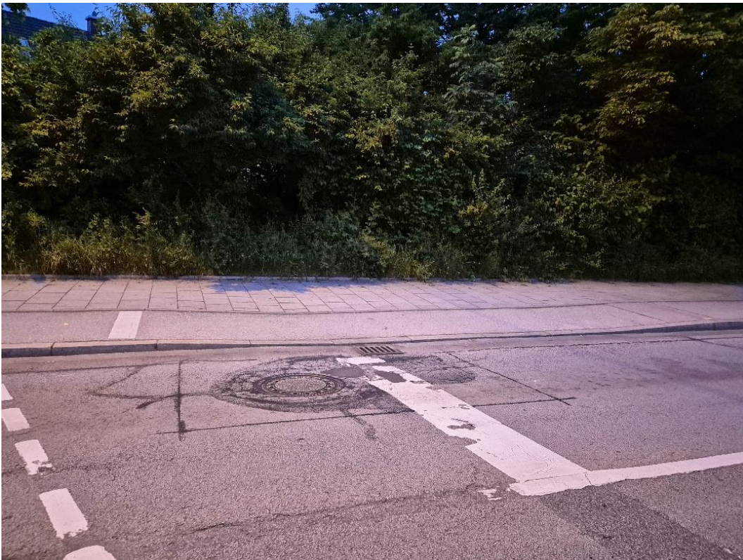
Schatzbogen nordwestlich II: Bordsteinabsenkung direkt vor Fahrspur und im Wartebereich der Fahrradfahrer.