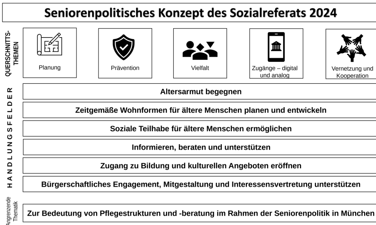
Abbildung 2: Thematische Gliederung des Seniorenpolitischen Konzepts 2024