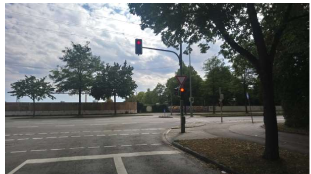
Bild 2 - Kreuzungssituation