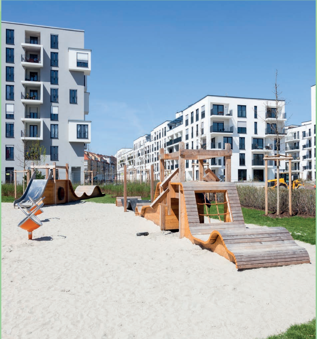
Im neuen Quartier auf dem ehemaligen „Agfa-Gelände“ werden städtebauliche Visionen Realität.