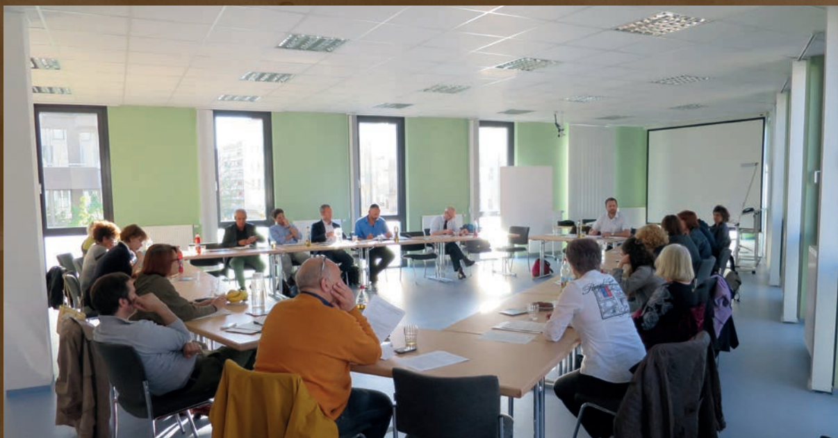
In der KGG – als einer der tragenden Säulen der Sozialen Stadt – arbeiten engagierte Stadtteilakteure gemeinsam an der Entwicklung Giesings.

Übergeordnetes Ziel bleibt die Verstetigung der erreichten positiven Veränderungen und Wirkungen über den Förderzeitraum hinaus. Konkret geht es darum, wie und wann die verbesserten Wohn- und Lebensverhältnisse im Quartier, die Organisations- und Managementstrukturen für integriertes Handeln sowie lokale Trägerschaften und Netzwerke stabil genug sind, um ohne Förderung und externe Betreuung weiter zu bestehen. Dieser Verstetigungsprozess wird bis zur Aufhebung der Sanierungssatzung unter Einbeziehung vieler Akteure aus Giesing sowie aus Politik und Verwaltung fortgeführt. Das Stadtteilmanagement fungiert dabei als Aktivierer, Berater, Koordinator und Know-how-Vermittler.