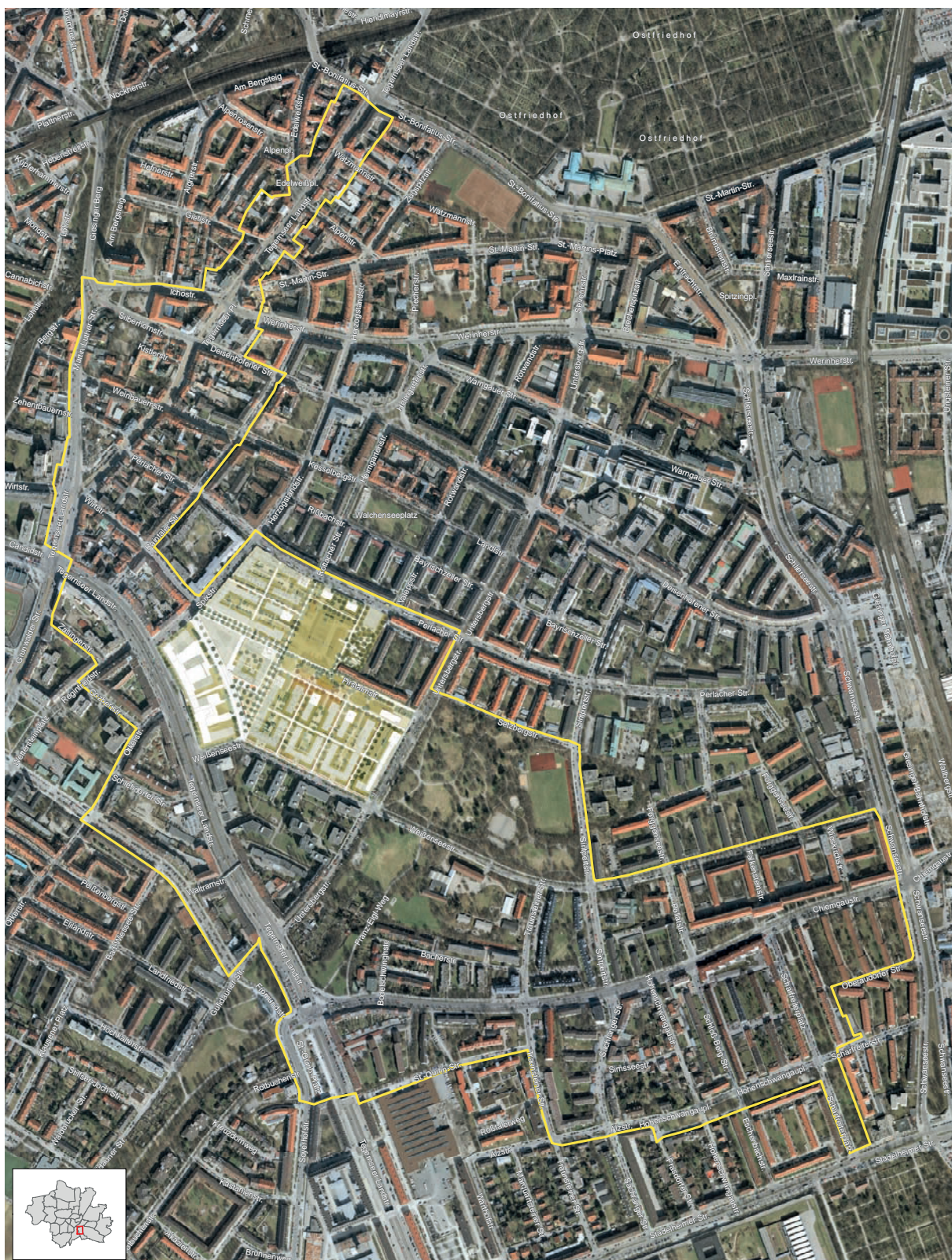
Das Sanierungsgebiet Tegernseer Landstraße / Chiemgaustraße