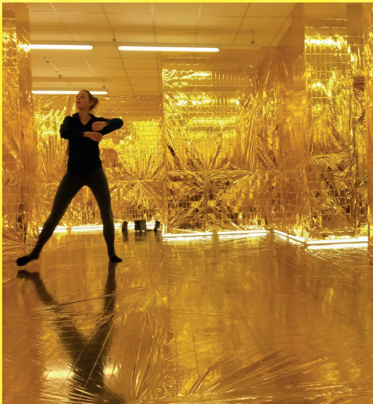
Kulturelle Zwischennutzungen – wie ‚hiSTOREy – Ladengeschichten‘ in der TeLa-Post – beleben leer stehende Ladenlokale.