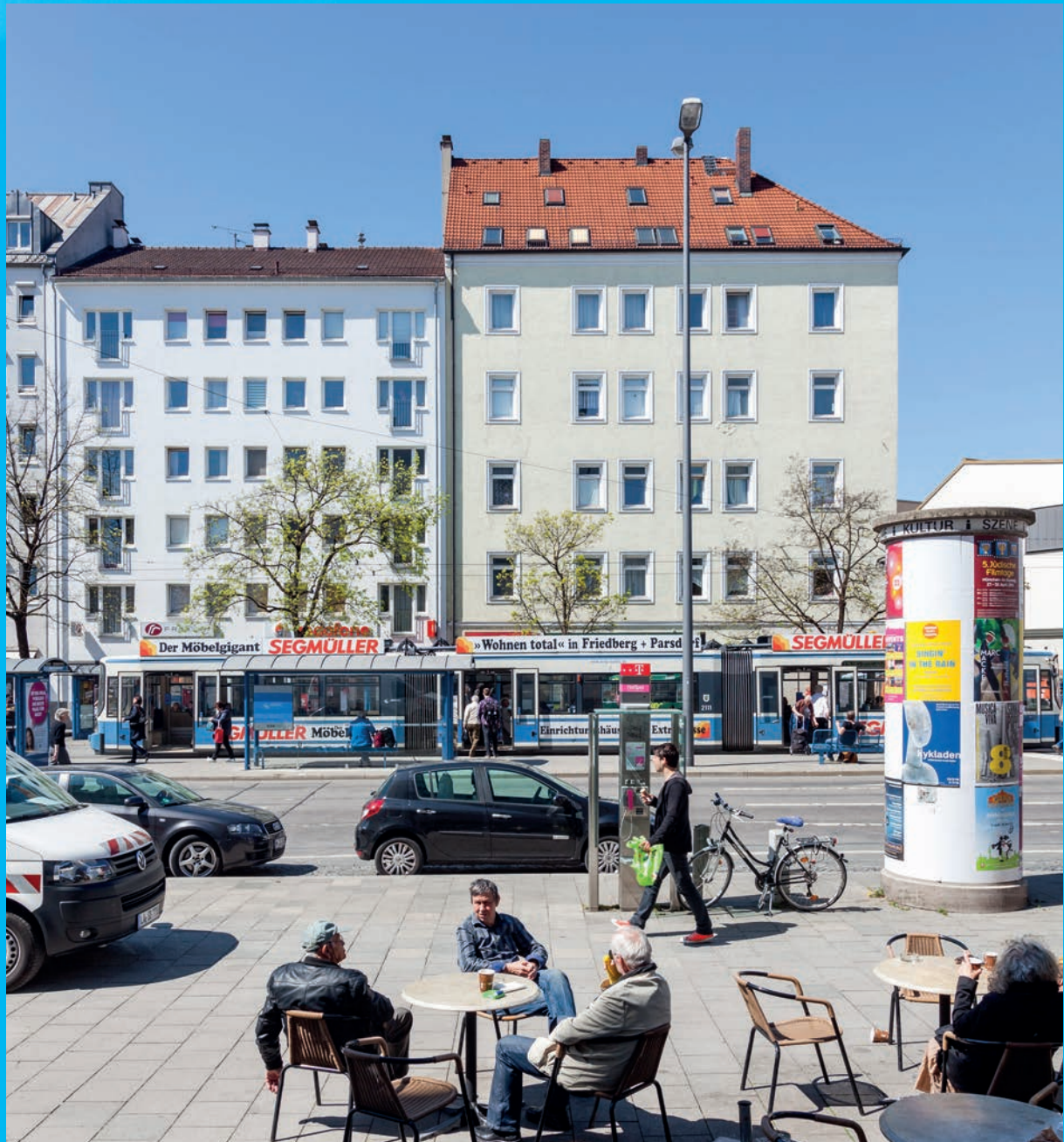
In der städtebaulichen Aufwertung der TeLa liegt eine große Chance für den gesamten Stadtteil.