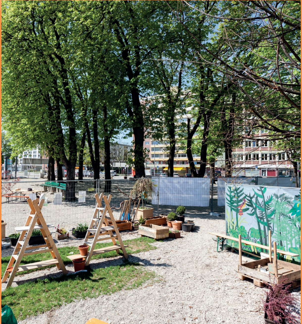
Auf dem ‚Giesinger Grünsplätz‘ gestalten Giesingerinnen und Giesinger ihren Begegnungsraum selbst.