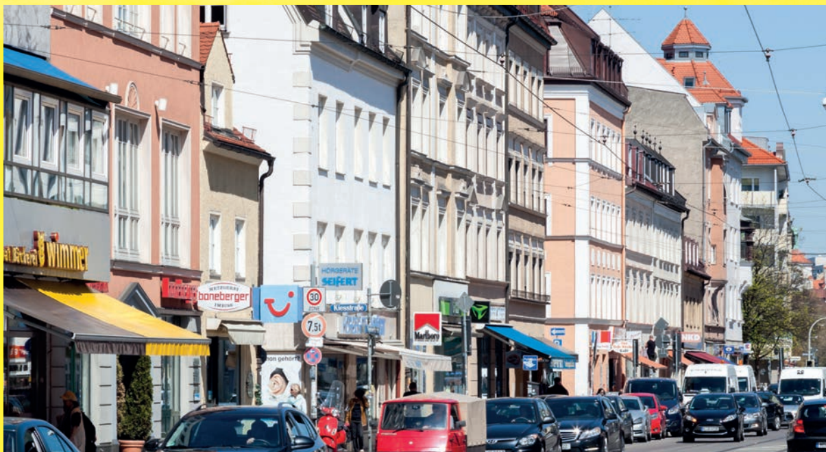
Das Stadtteilzentrum Giesing birgt ein erstaunliches Potential mit seiner Vielfalt an inhabergeführten Betrieben.