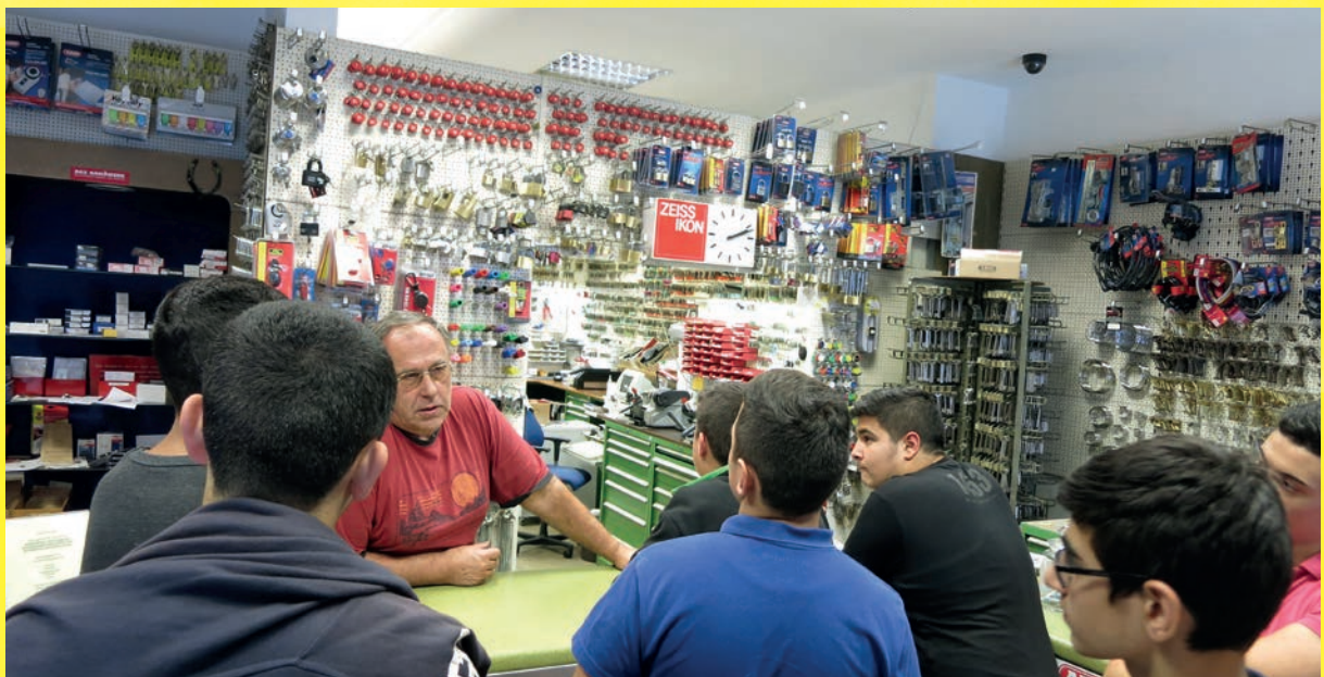
Am Giesinger Tag des Handels und Handwerks besuchten über 200 Schülerinnen und Schüler gut 20 Betriebe.