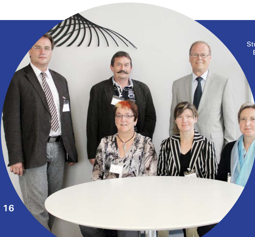
Studienbesuch bei der finnischen Einwanderungsbehörde

Im Rahmen von Studienreisen in ausgewählte europäische Länder erhalten die Teilnehmerinnen und Teilnehmer des Projektes die Möglichkeit, Erfahrungen mit europäischen Partnerbehörden auszutauschen und bewährte Praktiken kennen zu lernen, die gegebenenfalls übernommen werden können. Eine Mitarbeiterin des Büros für Rückkehrhilfen nahm im Juli 2013 an einer Studienreise nach Helsinki teil.