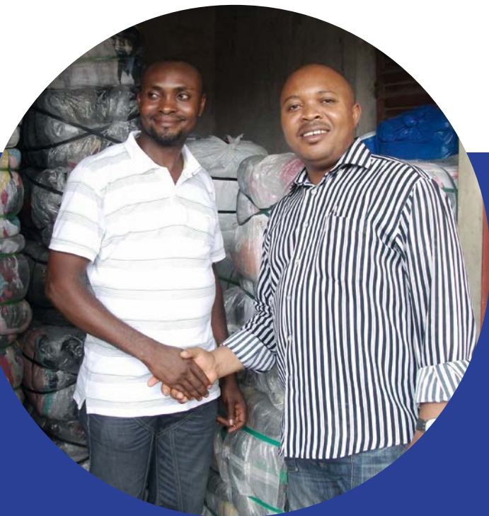
Herr U. (links) wurde bei der Geschäftsgründung von einem Mitarbeiter (rechts) einer einheimischen NGO unterstützt.

lichen. Sie vermittelte den jungen Mann in das Rückkehrprojekt ERI, „European Reintegration Instrument“. Mit Hilfe eines nigerianischen Projektmitarbeiters vor Ort konnte Herr U. ein Geschäft für gebrauchte Kleidung in der Nachbarrepublik Benin eröffnen. Dort hatte er vor seiner Flucht nach Deutschland mit seiner schwangeren Freundin gelebt. Nachdem Herr U. nun für den Lebensunterhalt sorgen kann, wird er demnächst heiraten.