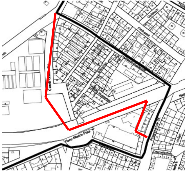
Untere Weidenstraße – Claude-Lorrain-Str. – Bahn-Südring – Pilgersheimer Str.