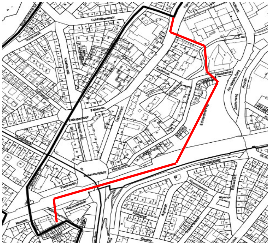
Entenbachstr./Pilgersheimer Str. – Voßstr. – Kupferhammerstr. – DB Südring – Nockherstr.