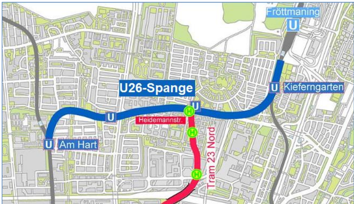
Abbildung 2: Plandarstellung mit Hervorhebung der U26-Spange (nicht-lagegetreu)