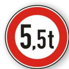
Abb. Nr. 262 ähnlich:

(Ergänzend zu 3.3.6.6, von TO vom 26. April 2022. Verkehrsrechtliche Anordnung Über der Klaue - Vollsperrung ab 11.04.2022) / nun bis heute, Dienstag, 3. Mai 2022!