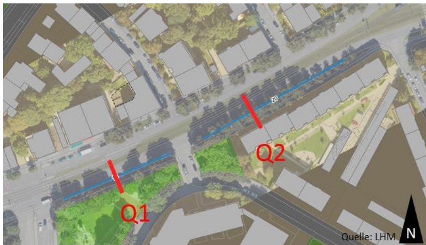
Abbildung 1: Verortung Straßenquerschnitte.

Ein beauftragtes Ingenieurbüro hat mittels einer Verkehrsuntersuchung Varianten aufgezeigt, die die Einrichtung einer einstreifigen Führung für den Kfz-Verkehr vorsehen (siehe Straßenquerschnitte in Abbildung 1 und 2).