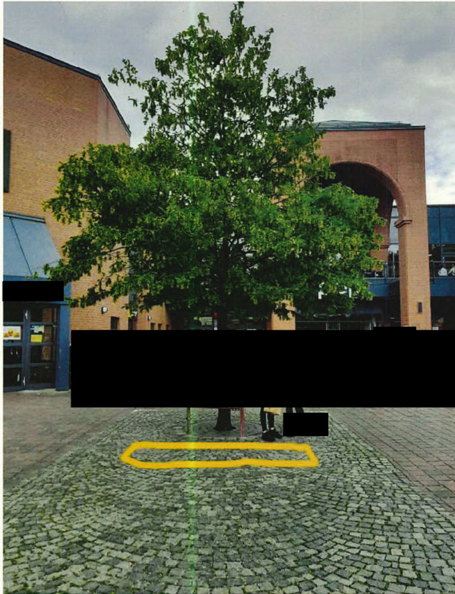
PEP - Standort 2